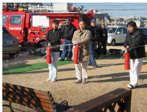
消火器を使っての初期消火訓練、3人一緒に！