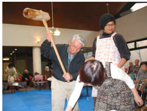
よいっしょ！元気な掛け声があがります。

12月25日、恒例の餅つき大会がコンサルテ瀬田あけて行われました。入居者の皆さんは、次々と元気に杵を取って、楽しいひと時に元気な汗を流しました。