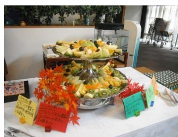
フルーツバイキング