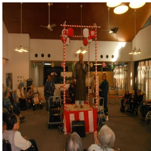
櫓を囲んでの「総踊り」