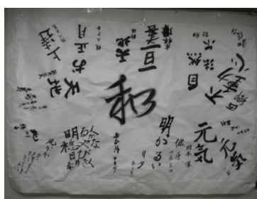
二階入居者様の作品