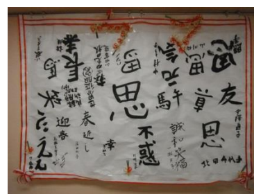
三階入居者様の作品