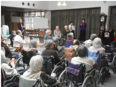
E.T と歌おう会 様

すずらん会様は今回で二回目のご来館です。三名の入居者様が皆様の前で歌って下さいました。