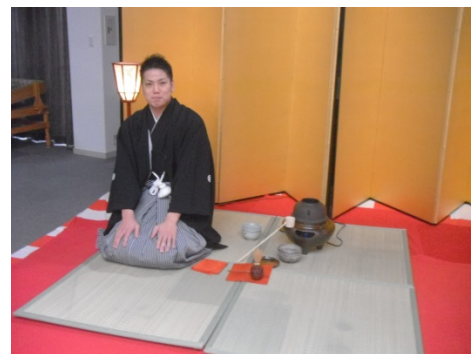
お茶会 職員によるお点前