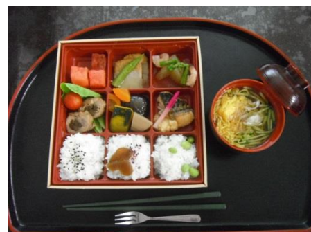
日本の四季弁当：向日葵の思い出