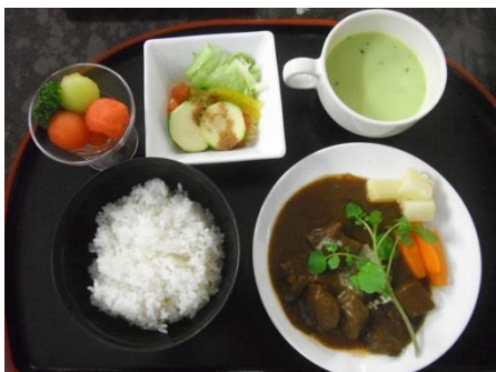
花火大会のお食事