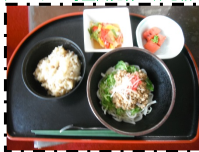
じゃじゃ麺 山菜おこわ フルーツ 鮭の南蛮漬け風