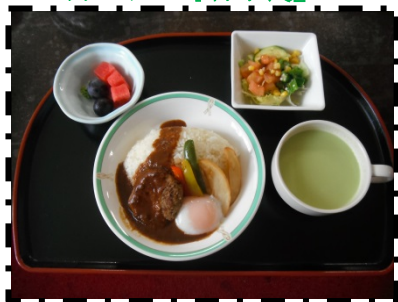
ロコモコ 生野菜サラダ スイカ ブドウ 枝豆クリームスープ