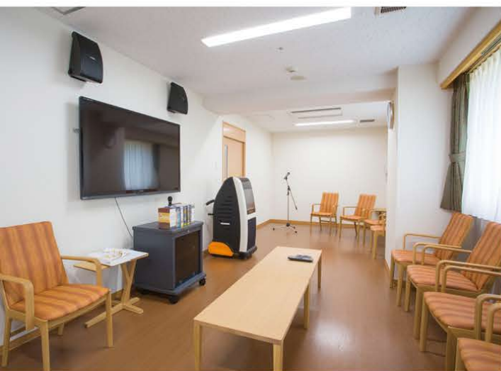
映画やカラオケを楽しんでいただけるシアタールーム