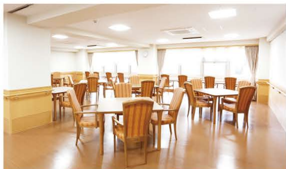
瀬田川からのあたたかい木漏れ日が差し込む食堂

新緑苑の居室は、ご家族様も、ご入居者様も安心して お過ごしいただけるよう、安全性を重視した間取りが 特徴です。全室瀬田川を望めるワンルームのお部屋で、 仲間と楽しく過ごしたり、ゆっくりとお部屋で休まれたり と、ご自身らしい暮らしをご満喫頂けます。