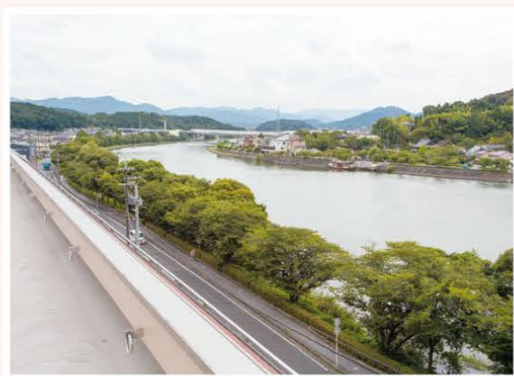
瀬田川のやさしい景色

※掲載の写真はイメージです。 ※ベッド(寝具)・収納家具等は持ち込みとなります。