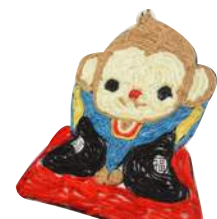
12月手作りレク 毛糸貼り絵